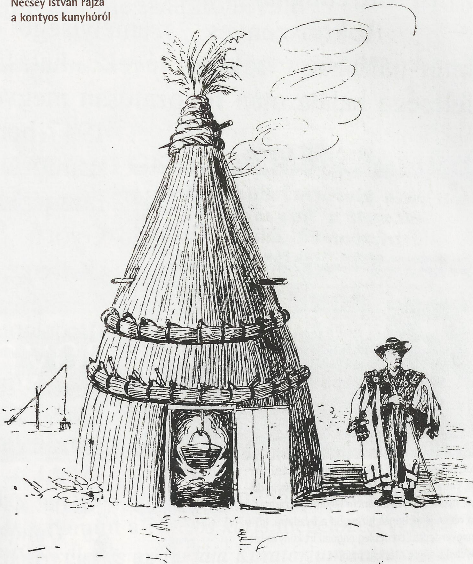
Nécsey István rajza a kontyos kunyhóról