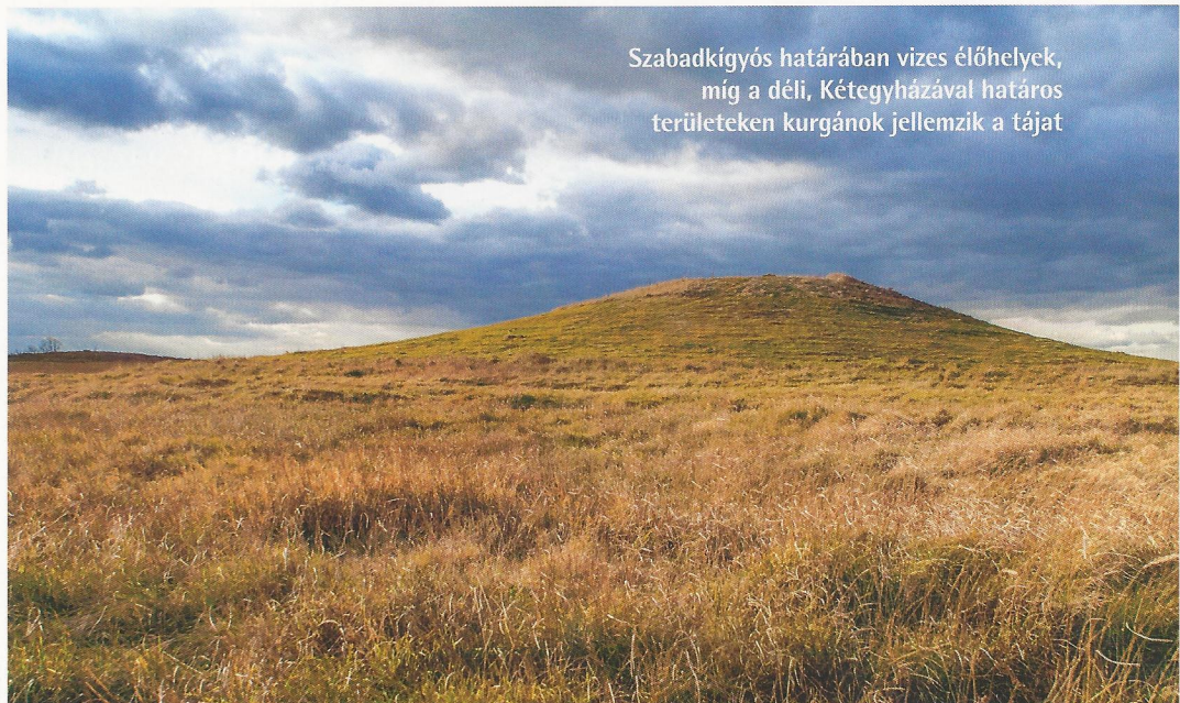
Szabadkígyós határában vizes élőhelyek, míg a déli, Kétegyházával határos területeken kurgánok jellemzik a tájat

A kistájmozaikon a szikes pusztai növényzet az uralkodó, amelynek jellegét a szikesedés mértéke, a vízellátás és a vízborítás időtartama határozza meg. Tavasszal a puszta alacsonyabb, szikes jellegű részein, elsősorban az északon fekvő Nagy-győpön és a Nagy-Csattogón, de a Kígyósi-puszta központi részén, Apáti-pusztán is jelentős vízállások alakulhatnak ki. Ezek a területeken zsiókás,