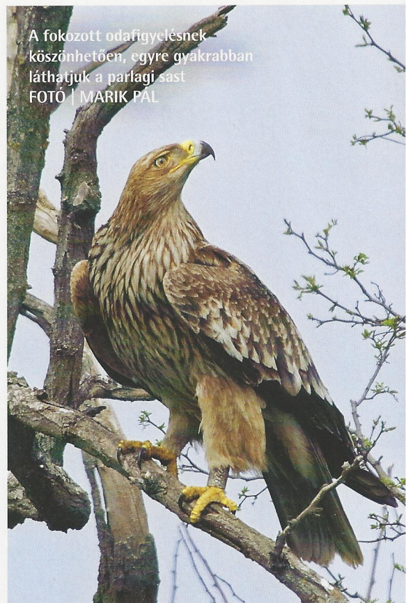
A fokozott odafigyelésnek köszönhetően, egyre gyakrabban láthatjuk a parlagi sást

A térségben fészkelő ragadozó madarak közül természetvédelmi jelentőségével kiemelkedik a kerecsensólyom , a parlagi és a rétisas . Nyár végi időszakban a közeli domb- és hegyvidéki területekről kígyász-ölyvek és pusztai ölyvek érkeznek, erőt gyűjtve a vándorútra való felkészüléshez.