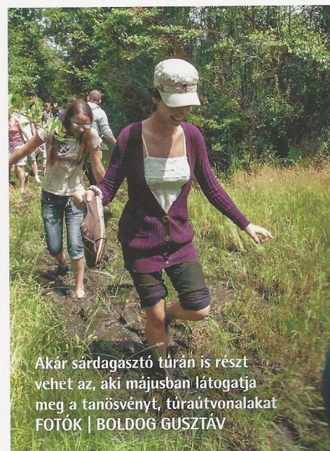
Akár sárdagasztó túrán is részt vehet az, aki májusban látogatja meg a tanösvényt, túraútvonalakat